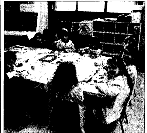
I bambini dell'asilo