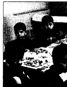
I piccoli alunni

Una struttura che opera da circa diciotto anni e si avvale della collaborazione dei volontari, il che ha permesso l'abbassamento delle tariffe. Un nido che segue un progetto educativo integrato e che mira allo sviluppo dei cinque sensi attraverso laboratori, gite scolastiche, attività pomeridiane e feste prevenendo il disagio infantile e giovanile e cercando di costruire un ambiente sociale in cui la solidarietà favorisca i rapporti tra le persone.