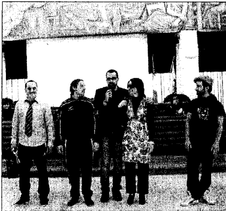
I giovani attori della scuola civica di teatro "Officine teatrali"