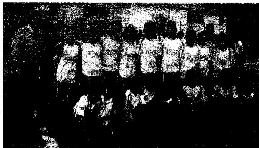
I ragazzi che hanno partecipato al progetto "Non solo gol" al Convitto Galluppi

Del resto il tema era "Nord-Sud uguale Italia". E ieri, letta dai bambini,