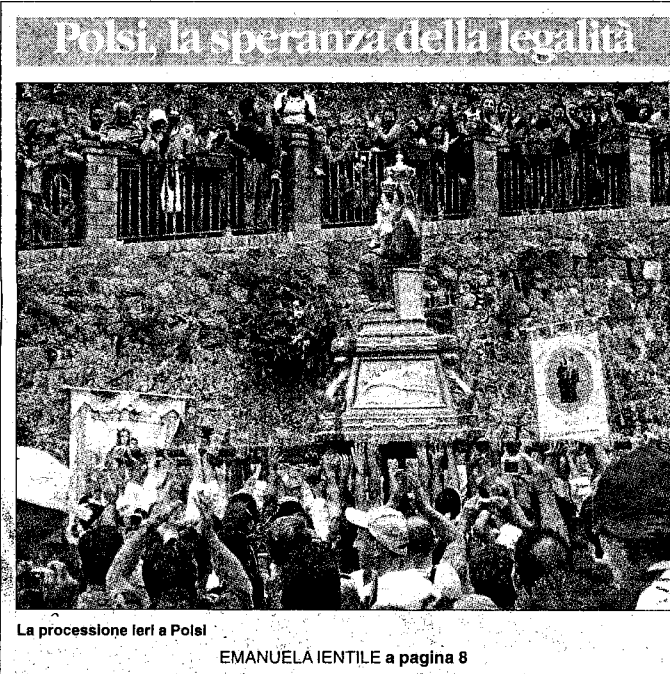
La processione ieri a Polsi