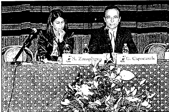
Il tavolo dei relatori del quinto congresso della Società italiana medicina urgenza emergenza pediatrica. Nelle immagini la prima giornata di lavori al Politeama

Questa sera la riunione dei presidenti regionali e del direttivo nazionale