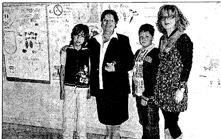
NELL'EDIZIONE DI DOMANI UN AMPIO SERVIZIO