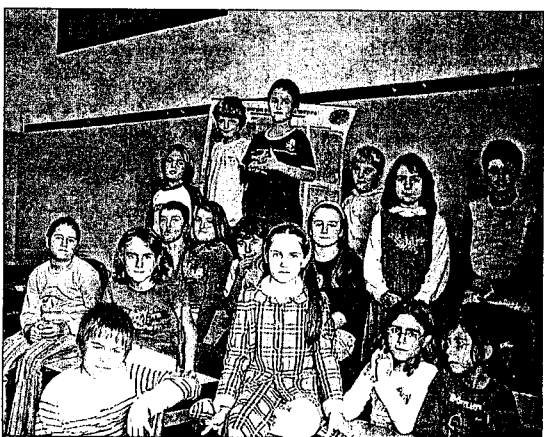
Importante iniziativa telematica organizzata al Convitto Galluppi