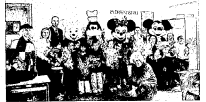
Un momento dell'iniziativa con i ragazzi del decimo Circolo

significare l'impegno dei cristiani a promuovere istituzioni capaci di aiutare l'uomo a formare il proprio cuore, affinché, libero da ogni egoismo, sia capace di autodeterminarsi, scegliendo sempre il bene comune. In quest'opera di formazione - ha concluso l'arcivescovo - valido contributo devono offrire le antiche istituzioni, quali la famiglia e la scuola, la cui opera è quanto mai preziosa e necessaria». (g.m.)