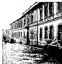
Il convitto Galluppi