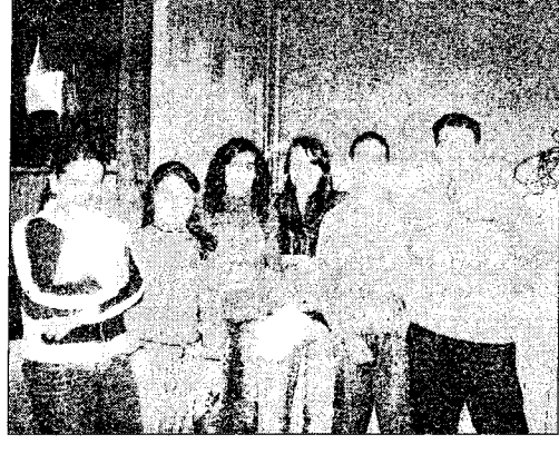
Gli alunni del Convitto Galluppi

Vicini alle autorità anche gli studenti dell'istituto, quelli delle medie e delle elementari, una cui rappresentanza ha letto una serie di pensieri incisivi in memoria dello scrittore di San Luca. Suona la campanella a mezzogiorno, la cerimonia si